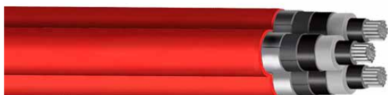
ARE4H5EX 3x (1x185) mm 2 12/20 kV CPR Fca